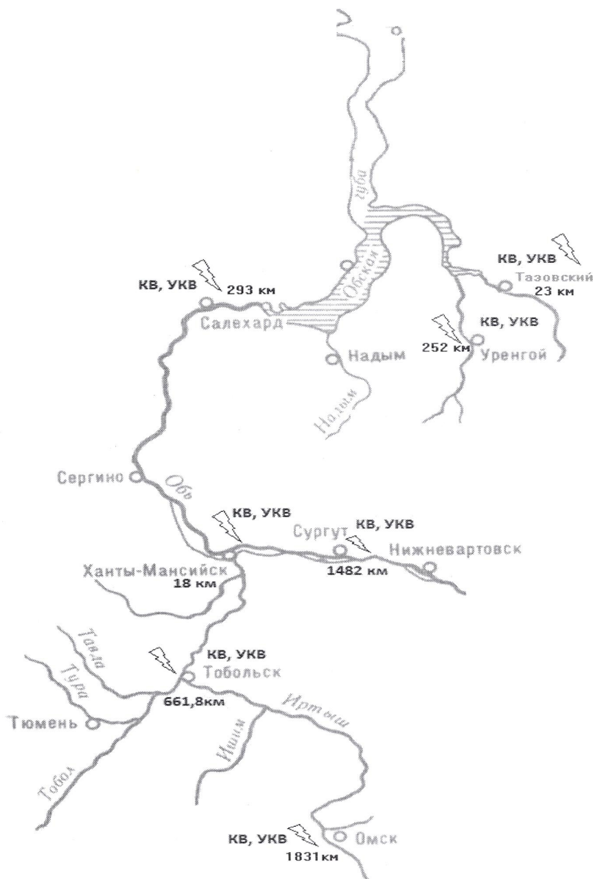
Схема технологической радиосвязи ФБУ «Администрация «Обь-Иртышводпуть»

Руководитель ФБУ «Администрация «Обь-Иртышводпуть»